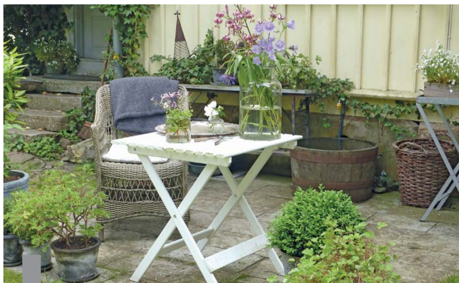
Die hohen Preise in den Großstädten sind für Immobilienkäufer und Mieter auf der Suche nach einem bezahlbaren neuen Zuhause frustrierend.

Seit der Jahrtausendwende zieht es die Menschen vermehrt in die Städte. Die Metropolen wuchsen. Dieser Trend setzt sich bis heute fort, doch einige große Städte wie Hamburg, München oder Stuttgart verzeichnen erstmals einen negativen Wanderungssaldo. Ein Grund sind die hohen Immobilienpreise und Mieten, denn für alle Metropolen gilt: Das Wohnen im Umland ist günstiger als in der Stadt. Das knappe Wohnungsangebot und die hohen Preise frustrieren die Nachfrager zunehmend und veranlassen sie, sich nach Alternativen umzuschauen. Der Blick geht an den Stadtrand, ins Umland oder in ländliche Gemeinden. Die haben über die günstigen Preise hinaus etwas zu bieten, was in der Stadt rar ist: die Nähe zur Natur, Entschleunigung, die Rückkehr zu Freunden und Familie. Laut aktuellem Baukulturbericht wollen 55 Prozent der 30- bis 40-Jährigen am liebsten in einer Landgemeinde wohnen, 27 Prozent in einer Mittel- oder Kleinstadt, aber nur 18 Prozent in einer Großstadt.